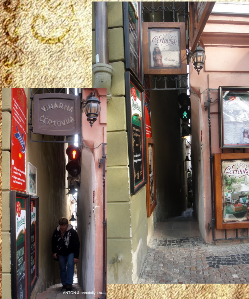
Улица Винария 70 см г.Прага