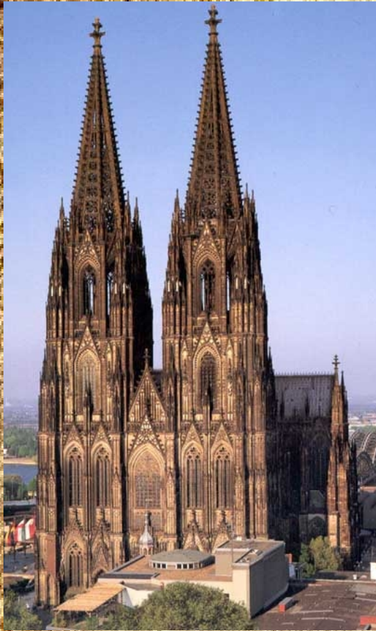
Кельнский собор 13 век Германия