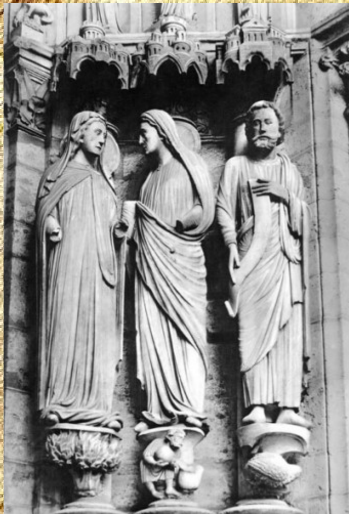
Встреча Марии и Елизаветы. Шартр. Франция. 12 век