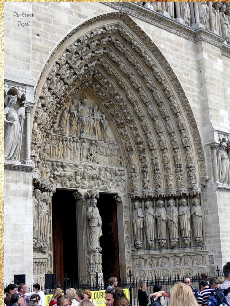
Нотр - Дам де Пари. Франция. 12 век