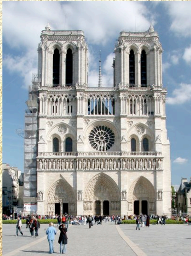
Нотер-Дам де Пари 12 - 14 века Франция