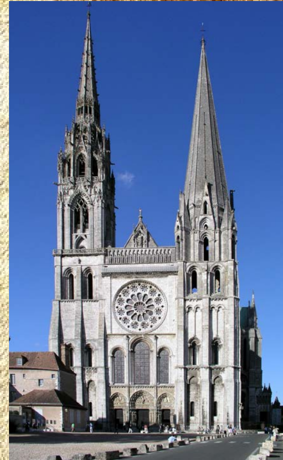
Шартрский собор 12 век Франция