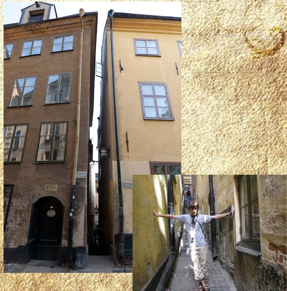
Улица Мортен Тротцигс Грен г.Стокгольм